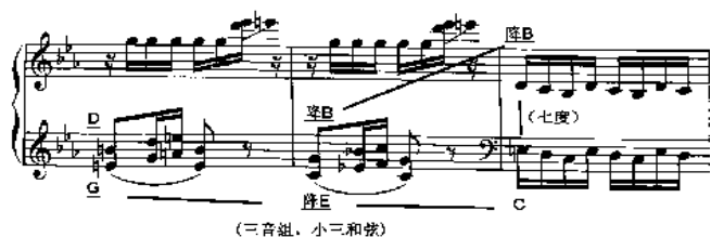
图 3 第 35-37 小节

段落 c 为技巧型段落, 右手以快速的重复八度强奏为主, 左手以音束为主, 依旧是围绕着“G 角音”所展开的写作。接下来的段落 d 的音乐取材来自“布老虎”与“木偶人”主题素材, 两个主题以片段出现的形式结合在一起, 而在调性上也呈现出较为精心的设计。