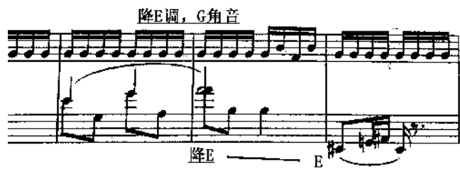
图 2 第 29-31 小节

E 调, 右手维持原调降 E 调, 双手调性呈七度关系行进直至段落 c 开始第 31 小节才回到统一的原始降 E 调性, 如图 2。