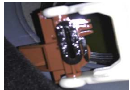
图 2 故障点照片