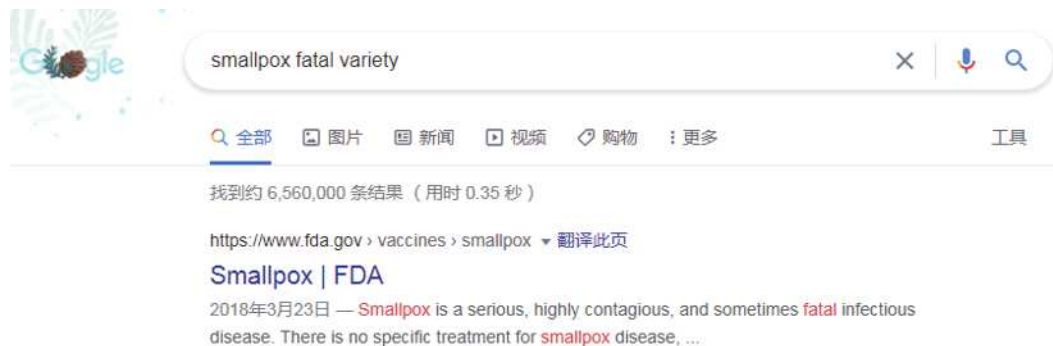
图2 以“smallpox”“fatal”和“variety”为关键词的部分检索结果

欲提升搜索结果,需要在文段内容中寻找更有价值的关键词。例如:排在第一的检索结果,大致说明了大多数曾经罹患天花的患者存活。然而,有一些种类的天花非常致命,并且针对对象通常是孕期妇女以及免疫系统受损的人。而成功存活的患者也有很大几率会在脸上、手臂或者腿上留下瘢痕。