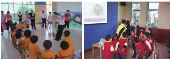
图 3 动作记录图

动作记录是用动作表现自己观察到的现象, 这样的记录是幼儿园小班孩子最适合的形式, 它比较生动形象, 能够发展幼儿的创造力, 调动其生活经验, 丰富其想象力。