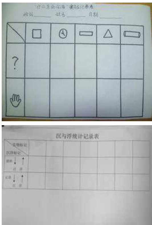
图5 设计观察记录表的图

科学教育活动是以幼儿的主动探索为核心要素,这样就要求幼儿都能积极进行思考,能动手参与探究式教学活动的全过程,但是很多时候,幼儿园教师的示范和讲解过程就把幼儿的思维能力局限在一块四方天地之中,谈发散思维的培养根本就是“天方夜谭”的事情。在科学教育活动中,教师在对幼儿的示范时,把自己的思想强加于活动中,把幼儿的探索活动变成了科学验证活动,教师拿出记录表示范讲解时,他按自己预先想好的方式进行,制作出不同形式的记录表,如图所示: