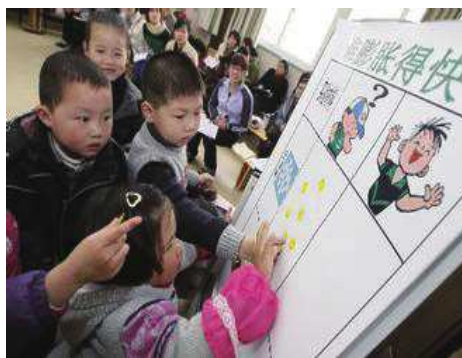
图 4 间接补充记录图