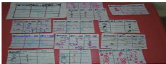
图 1 符合记录图

符号记录是幼儿用自己能够理解的符号把简单的试验和观察过程中的现象展现出来, 易于操作又让幼儿加深对过程的理解, 符合幼儿的年龄特点。