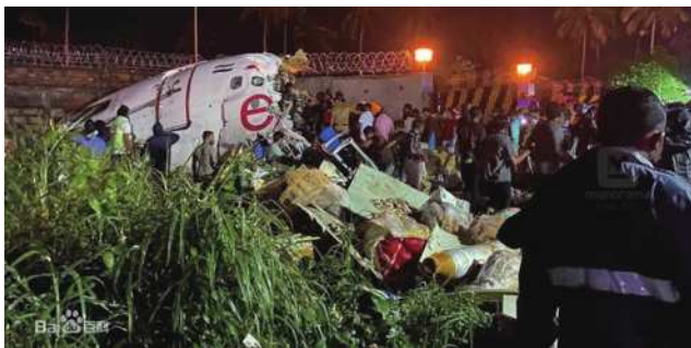
图1 污染道面飞机冲偏出跑道事故

“安全”是民航业的生命线。随着航空运输业的迅速发展, 国内外飞机在污染跑道起飞和着陆过程中发生冲、偏出跑道事故及事故征候时有发生。飞机起飞、滑行和着陆阶段是航空事故高发阶段。据统计, 20世纪90年代以来到21世纪初, 发生在滑行、起飞和着陆阶段的事故占总事故的百分比高达64%, 而死亡事故占总事故总数10%, 在数百起地面飞行事故中, 湿跑道和污染跑道所造成的地面失事超过50%。受污染跑道表面状况评估和报告不准确、不及时, 造成制动性能下降, 是飞机冲偏出跑道的主要因素之一。因此, 对污染跑道状况进行及时准确地评估, 对保障飞行安全具有重要意义。