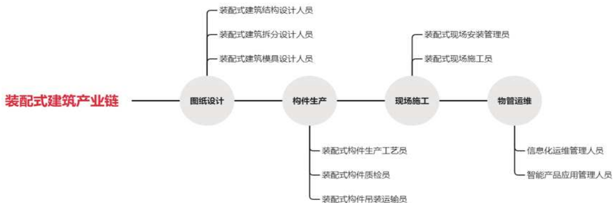
图一 装配式建筑产业链

建筑产业转型升级在持续推进, 智能建造、智慧建筑的提出也为装配式建筑的发展提供了契机。鼓励企业进行工厂化制造、装配化施工、减少建筑垃圾、促进建筑垃圾资源化利用是全国各级政府目前力推的事情。以湖北省为例, 湖北省住房和城乡建设厅最新下发了 2022 年度装配式建筑的目标任务, 2022 年度全省装配式建筑目标为 3210 万 m 2 , 其中武汉市 1600 万 m 2 , 襄阳市 400 万 m 2 , 宜昌市 400 万 m 2 。以装配式建筑为主导的建筑工业化正在持续推进。在这种背景下, 装配式建筑人才所需比例不断增大, 具体如下: