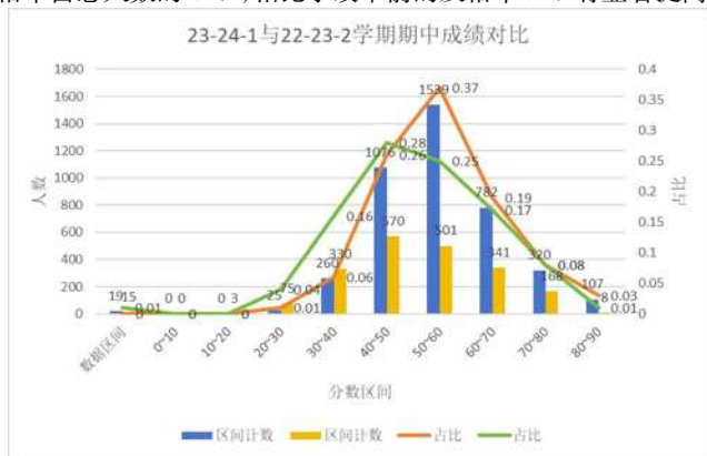
图 2 改革前后期中成绩对比

目前,本学期的期中考试已经顺利结束,从表 1 的成绩对比中可以看出,中等偏上的 70~100 分区间人数有明显上升,及格率占总人数的 67%,相比于改革前的及格率 51%有显著提高。