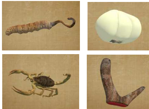
图1 部分中药的3D模型截图

数字影像技术+3D药材模型+平板电脑。电子沙盘可展现出各地区逼真的地形地貌,展现出各种道地药材的分布情况和药材特征。与以往的2D电子沙盘不同,本课题组与技术公司合作,参照药材实物、抓取典型性状特征,制作成生动形象的药材3D模型(图1)。药材3D模型可更好的为学习者提供真实、独特感知以及交互的体验、教学和研究平台。学习者可以通过平板电脑,对药材模型进行三维旋转、缩放,并且可将3D模型切开观察其断面特征。数字技术的应用有效提高了学习的互动性和直观性,同时也能够对宣传中药知识、中医药科普教育和中国产业发展,有了非常大的影响。 [5]