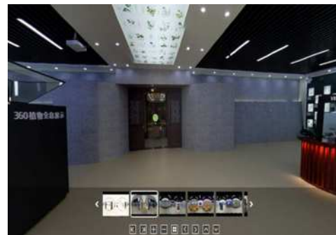
图 3 网络虚拟数字标本馆首页