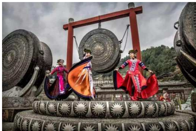
图一：广西壮族铜鼓

说鸟类的后代是壮族。它们穿梭于天地之间，向往芒太阳，抗拒地心引力的神秘力量，让它们倍感自豪。壮族人不喜欢腐朽的孔孟伦理，他们也痛恨权力体系的统治意识。生活在权力结构中，层层压制，他们会窒息。天真浪漫，不羁放荡。为自己而活是对社会最大的贡献。所以，本质上，壮族喜欢做一只鸟。