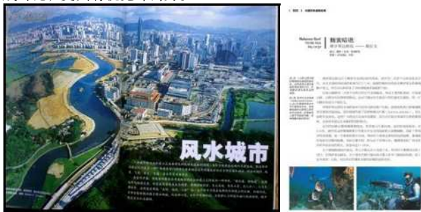
图 5-5 《中国国家地理》杂志内文标题

《中国国家地理杂志》标题文字多采用大号微软雅黑字体,大气浑厚突出,如图 5-5 和图 5-6 所示,与正文部分的小楷体形成对比,更具有视觉冲击力。