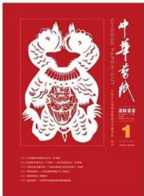
图 2-1 《中华剪纸》2022 年第 1 期封面

目前市场上的剪纸文化杂志较少, 我们以较为成功的《中华剪纸》是国内外唯一发行的专业剪纸期刊, 由中华文化促进会剪纸艺术专业委员会主创, 杂志整体呈现出沉稳、大气、权威的特点, 如图 2-1 所示。