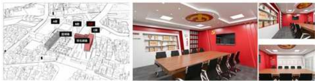
(图1:课程成果,广东林头社区党群服务中心党员先锋队建设项目)

学习内容：将景观设计教学分为三个阶段：第一阶段学习基础理论及收集国内外优秀的社区改造案例，学生从中感性获知；第二阶段学生通过网络资源和实地调研，在充分了解基地概况，从而进行设计，这是理解分析阶段；第三阶段是成果汇报阶段，通过小组讨论及汇报，教师与学生之间进行互相点评以及将相关的图纸方案反馈给社区，聆听其意见进行再修整。