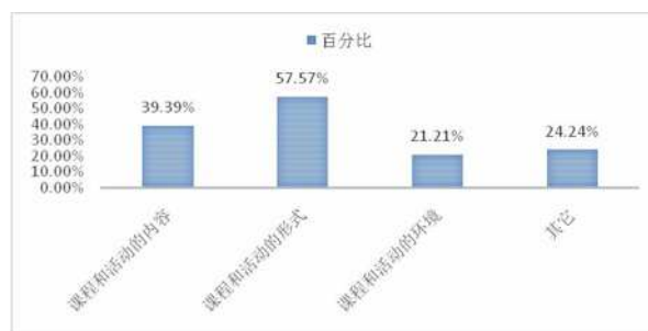
图 3 学生参与课后服务形式分析

从图 3 可以看出, 在对学校开展的课后服务持消极态度的学生中, 认为课程和活动内容需要改进的占比 39.39%, 认为课程和活动的形式需要改进的占比 57.57%, 认为实施课后服务的环境需要改进的占比 21.21%, 认为在其它方面需要改进的占比 24.24%。从学生的视角来看, A 校的课后服务在服务内容、形式、环境等方面存在诸多不足, 需要结合当地和学校的实际情况进行完善。