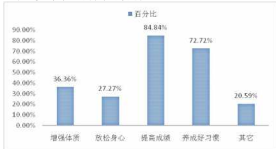
图 2 学生参与课后服务效果分析

由图 2 可以看出, 学生对于课后服务的实施效果, 希望增强体质的为 36.36%, 表示在课后服务过程中, 实现放松身心、提高成绩、养成好习惯以及其它效果的分别为 27.27%、84.84%、72.72%、20.59%。通过对以上数据的调查和分析, 可以发现至少 7 成以上的学生希望通过课后服务可以提高成绩以及养成好习惯, 这从侧面表明学生对课后服务的目标定位有所偏差。