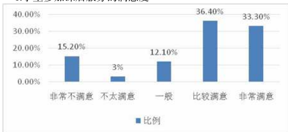
图 1 学生参与课后服务满意度分析

从图 1 可以看出, 学生对参加的课后服务持非常不满意态度的占比 15.20%, 对课后服务不太满意的占比 3%, 持中立态度的占 12.1%, 持比较满意态度的占比 36.40%, 持非常满意态度的占 33.30%。从这些数据可以分析得出, 6 成以上的学生对当下参与的课后服务持积极态度, 少部分学生持消极态度。