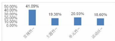
图2 幼儿教师主要采用的音乐教学活动组织形式调查

如图2所示,有41.09%的幼儿教师将常规性音乐活动视为首要选择的音乐教学活动组织形式,而其余选取主题性音乐活动、活动区音乐活动、单元性音乐活动的幼儿教师所占比例则相差不多。