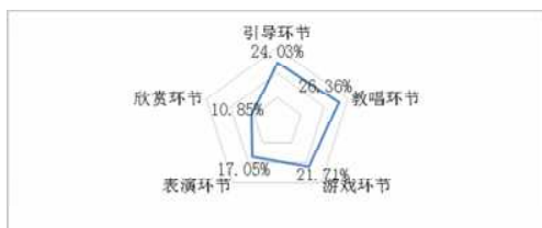
图1 幼儿园音乐教学活动设计侧重点调查

如图1所示,大部分幼儿教师在设计音乐教学活动时更加侧重于教唱环节,约占总调查人数的26.36%,与其数量相仿,有24.03%的幼儿教师在设计音乐教学活动时更加侧重于引导环节;其次是游戏环节与表演环节,分别占21.71%与17.05%,而在设计音乐教学活动时更加侧重于音乐欣赏环节的幼儿教师最少,仅占总人数的10.85%。