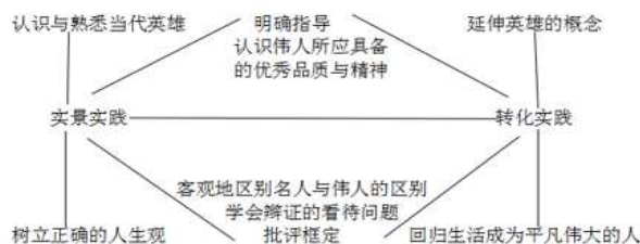
图2 道德教育的多元读写教学法图例