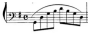
图二: 动机 2

歌曲的1-4小节为引子部分,钢琴伴奏高音声部第一小节从主和弦开始,二八节奏型整体下行至二分音符主和弦,采用逆分型组合节奏型,这是该曲的音乐动机1;第2小节就是由动机1下行五度发展而来;第3小节节奏型由动机1的节奏型发展而来,从G大调降六级音开始整体下行至主音后整体上行至属音;第5小节二分音符属和弦半终止引子部分。钢琴伴奏低音声部第1小节采用八分