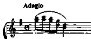
图一: 动机 1