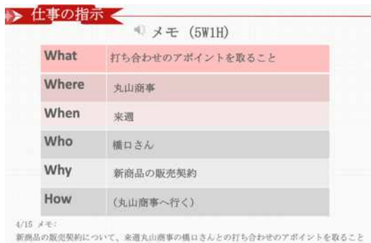
图3 5W1H 笔记速记