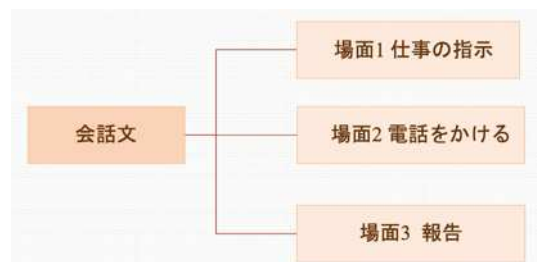
图2 会话文场景驱动

在完成基础的日语语言学习之后,笔者会对课文或者会话文部分进行筛选,有重点地讲解。比如第四课选择着重讲会话,这是为提高学生的职场语言运用能力。这是根据《大学日语教学指南》(2021版)中对大学日语的课程性质(大学日语可通过学习与专业或未来工作有关的学术日语或职业日语,让学生获得在学术或职业领域进行交流的相关能力)而设定的。首先,笔者按照下图2设定并驱动交流场景1;其次利用会话文让学生体验秘书身份,完成下图3“5W1H”笔记练习,场景1主要是训练学生听写能力,增强输入。然后围绕学生笔记教师开始驱动场景2-给合作公司打电话,在此场景下教师可以结合课文如下图4一样分析打电话流程,锻炼学生的口语输出能力。最后场景3为扮演秘书身份的学生向上司汇报沟通结果。这三个场景也让学生体会了日本企业文化中所强调的“報・連・相” ① 的重要性。