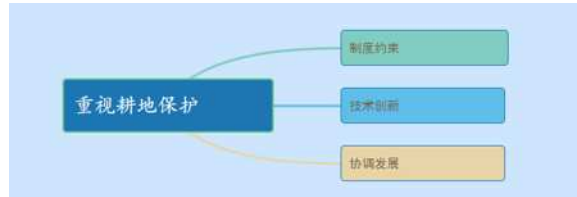
图3 耕地保护结构示意图

(3) 协调发展。在土地经济和农业经济协调发展的过程中,需要以具体区域的实际情况为核心制定协调发展的政策,可以提高粮食交易价格,增加粮农收入。