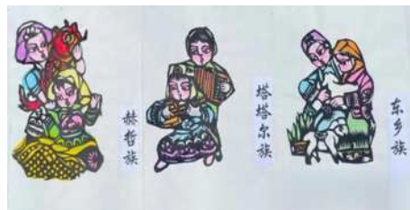
图2 富平县非遗剪纸少数民族展示图

首先, 在项目成立初期, 以富平县为剪纸文化的弘扬基地, 培养一批对剪纸文化具有浓厚兴趣的青少年传承者, 以此形成具有优秀传统剪纸技艺和现代化剪纸思想的新生力量。其次, 从这批新生力量中选取最优秀的成员加入小程序的设计部门, 形成小程序设计板块的优秀设计者, 不断创造新的剪纸设计产品。最后, 与剪纸前辈们达成文化战略合作, 借助富平县剪纸文化老辈手艺人培养的剪纸文化新生力量去辐射周边的县、区, 进而带动更多的人学习剪纸技艺和剪纸精神。与此同时项目将致力把现代化的设计理念与传统中国的剪纸文化风格相结合, 不断更新和发扬。最终形成一个以富平县剪纸文化为中心不断交流、辐射、共享的剪纸现代化发展体系。