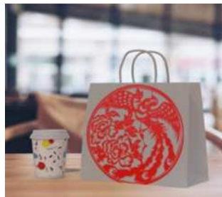
图3 剪纸文创商品包装图

在文创阁小程序的运营上, 小程序项目设计部和宣传部则会针对优秀的剪纸作品进行整理、分析、再设计, 最终在小程序上形成可以供售卖的剪纸产品。此外, 技术部将对作品中的图形元素进行提取, 并广泛应用于自主设计售卖的文创产品, 例如收藏物件设计、产品包装、文具美化、服饰设计等。