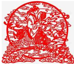
图1 剪纸牛郎织女图

皆来自于古代的神话传说和戏曲剧本等。总之，广大劳动人民将生活中的喜闻乐见都融入到剪纸艺术的创作之中，剪纸艺术承载着广大劳动人民对于美好生活的向往与追求，对生命歌颂以及对于自然生活的热爱。