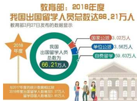
图2 2018年我国出国留学生占比

从我国教育部门2018年的统计数据来看,公派留学生只有3.02万人次,而当年我国的出国留学生总数为66.21万人次,公派留学生占总量的约4.6%,比重非常低,是所有出国留学生中占比最小的部分 [4] 。