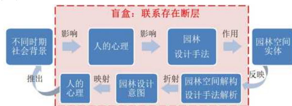
图1 理论理解与设计存在断层

其次,历史园林遗存少,学生无法设身处地的感受园林,对园林的鉴赏能力较低,空间认知感较弱,对造园手法的理解难度较大,不理解园林设计与社会历史背景之间深层次的联系(图1),不理解显性园林物质空间与隐性价值观之间的关联 [9] ,认为学习园林史对设计能力的提升没有帮助,因而学习兴趣不高,课堂参与度不足,互动有限。