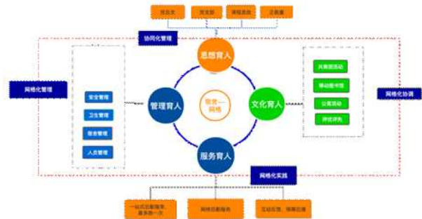
图2 学生公寓网格化服务管理育人实践

服务管理资源是方式，对症下药打出民办本科公寓三全育人的组合拳，实现培养新时代德智体美劳全面发展的时代新人。具体见图2。