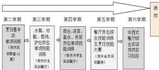
图2 学徒生产实践课程流程图