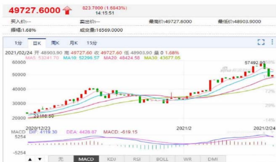
比特币价格受特斯拉影响一路飞升

我们知道，法币，是由国家发行的，以国家作为信用担保的货币。而比特币是去中心化的，它并没有发行机构，这就意味着它没有国家信用做担保，它的涨跌完全取决于持有人以及公众对于它的热情或者态度。近日，马斯克投资了15个亿比特币，一时间，比特币的价格一路大涨并且创下新高。后来，马斯克又公开表示比特币价格虚高，比特币又开始猛跌，我国国内很多购买比特币的投资者纷纷爆仓。由此，我们可以看见，资本大鳄和比特币的高级玩家对于比特币价格的影响是巨大的，甚至是决定性的。