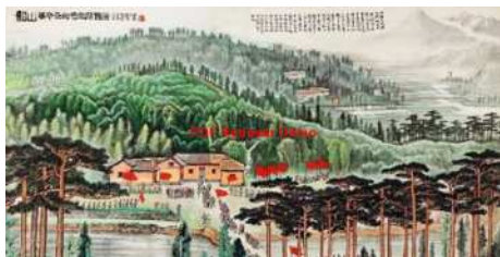
李可染《韶山 革命圣地毛主席旧居》

中体现得淋漓尽致。从可染先生在这幅巨作中对光的细腻处理，营造整个画面微微逆光之感，表现自然界的光色之美，这也是在古代中国画中所看不到的，是李可染山水作品融合了西洋画的表现技法于其中，增强了中国山水画的时代感。李可染的山水画深厚而凝重，以鲜明的时代精神和独特个人艺术思想促进了传统中国绘画的变革与升华，冲破传统艺术的藩篱，展开了中国美术史上划时代的新篇章。