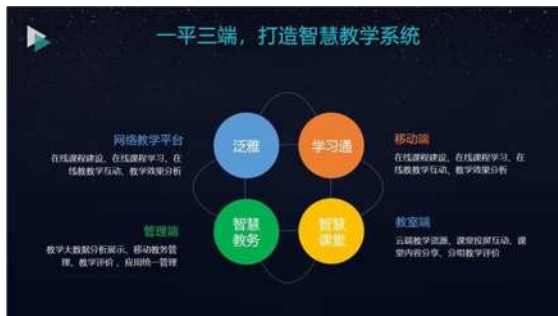
图 1 线上线下混合式教学示意图

“金课”是指教育部在一流课程“双万计划”中所建设的 1000 门国家级一流课程以及 10000 门省级一流课程。“金课”最重要的标准就是需要具备“两性一度”的特点。“两性”指的是“金课”需要具备高阶性和创新性这两个特点,而“一度”指的是其需要具备适宜的挑战度。在教学目标上,“金课”需要呈现出一定的课程高阶性,要让学生能够在掌握基本知识的前提下,尽可能提高学生的综合能力。而创新性是指“金课”建设的内容与模式需要具备一定的创新度,要打破传统教学思维定式,以新颖的教学评价来进行课程体系的构建。通过具备“两性一度”特点的金课教学,能够让学生达到知行合一的教学目的,进而提高学生的知识技能和解决问题的综合能力。如图 1 所示,其为线上线下混合式教学示意图。