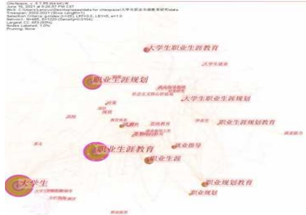
图 3 关键词知识图谱

关键词是论文核心和内容的精炼表达，通过关键词及频次分析可以直观显示该主题的研究热点。本研究利用 CiteSpace 软件对 2002 - 2021 年我国大学生职业生涯规划相关主题研究关键词进行共现分析，得到关键词知识图谱（见图 3）。通过图 3 发现：职业生涯规划，就业指导，就业能力等是研究者主要关注的关键词，也就是说在我国大学生职业生涯规划研究中以上这些是学者的研究倾向与关注焦点。