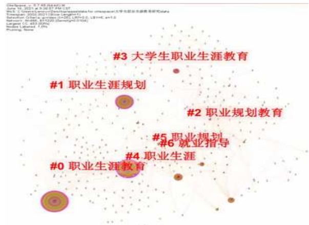
图 4 大学生职业生涯规划教育关键词聚类知识图谱

为了了解我国大学生职业生涯规划研究对象的主要涉及领域，对其进行关键词聚类分析。在关键词共现图谱的基础上选择 LSL 聚类算法，对该研究领域的关键词进行聚类分析，得到关键词聚类图谱。该图谱中共计产生了 13 个聚类，选取其中 7 个包含内容较多且具有代表性的聚类，得出该领域的关键词聚类分析最终图，如图 4 所示。之后在“cluster”菜单中选择“Summary Table”，得出关键词共现网络聚类表（见表 2）。