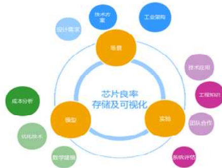
图3: 芯片良率及可视化实验设计及知识点支撑

在三位一体的创新教学环节中,教研组结合本专业毕业要求,课程目标先进行课程设计,然后根据学时和实验时长进行任务分配。在设计完毕后邀请3-4名同学进行课程体验,教师在旁边观察学生完成情况,进行打分,最后进行教学反思,完善教学设计后再进行大面积授课。图3说明了教学小组对芯片良率数据库设计及可视化任务的课程设计拆分过程。在90分钟的授课时间内,教师将针对图中的三个大模块,十个小知识点展开论述、课堂讨论等。例如:对芯片良率存储过程,可以采取播放视频来进行,总体时间控制在10分钟以内,并在黑板上进行板书要点提醒学生视频中设计需求及技术方案要点。对于芯片良率可视化的模型选取,可以通过讲授,实验平台演示等方式完成,留出10-15分钟的时间给学生们进行小组讨论。对于实验部分,教师将实验任务分解到每位学生,和学生约定实验报告的格式及团队合作的细节,学生在规定时间内完成报告后,由教师评估实验效果和知识点的达成情况。