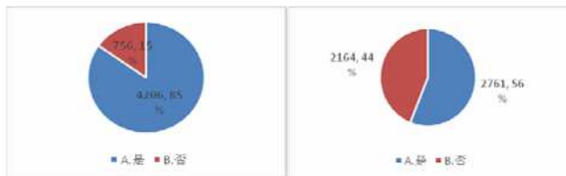
图 1.2.3 是否了解就业方向占比图 图 1.2.4 是否做好职业规划占比图

从了解就业方向占比图(图 1.2.3)中可以看出,有 85%的学生了解自己未来的就业发展方向,15%的同学对自己未来的发展方向还不是很清楚;而从职业规划占比图(图 1.2.4)中看到,在职业规划方面,还未做好规划人数占比达 44%,这说明在校生对生涯规划的需求程度较高,也从侧面反映就业中心公众号在下来的应用推广中应加大这一知识领域的普及度。