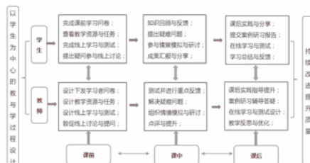
图 3: 以学生为中心的混合式课程设计

为了充分满足学生学习的需求，课程采用混合式教学模式，充分利用网络与现有教学资源，合理规划学生课前、课中与课后学习过程。课前学习主要是利用网络资源和提前录制好视频短片开展相关知识点的学习与相关话题的讨论与分享，为课堂的案例研习做好基础知识的铺垫；课堂则进行课前学习反馈及疑难问题解决，通过情境模拟与案例研习深化理解，组织小组进行学习成果的研讨与汇报，教师及时进行点评提升；课后进行实践及分享，按要求提交案例研习报告，进行课后学习的总结与测试，实现课程教与学质量的持续改进与提升，帮助学生更好的适应未来的工作岗位。