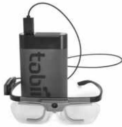
图 1 Tobii Glasses 3 眼动仪

1 所示。该设备以其高精度、高采样率及良好的佩戴舒适性，尤其适用于动态任务场景。实验通过记录飞行员在飞行任务中的注视点坐标、注视时长与运动轨迹，为研究其注意力分配模式及仪表熟悉度提供了关键的数据支持。每次实验结束后每个被试的试验数据都将被保存记录，再用软件对采集的数据进行分析对比，得出实验结果。每个被试课前课后采集两次眼动数据，然后导入专业软件匹配并分析。