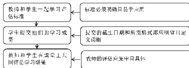
图 2.3 评价反馈阶段

通过在阅读教学前后对高、中、低三个水平层次的学生进行访谈，研究者试图了解他们在实施阅读策略前后对阅读教学态度的变化，从而为构建有效的英语阅读教学模式提供思路。研究采用访谈方法，根据学生的前测和后测成绩，从高、中、低三个水平层次中各选取 5 名学生，共 15 名学生进行访谈。访谈在实验结束后进行，每次访谈大约持续 15 分钟。在访谈过程中，研究者询问学生对英语阅读课的态度、阅读习惯以及策略使用情况，并详细记录访谈过程中的整个对话。访谈结果的分析将使研究者能够观