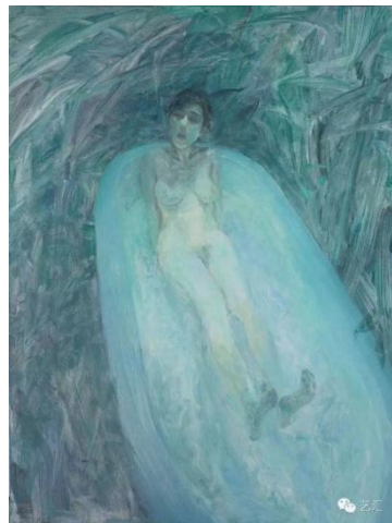
图 5 《兔子奥菲莉亚》2011

2010年后,抽象符号阶段的兔子系列中何多苓延续了以往作品中的隐喻的特质和抒情诗意。2010年创作的《兔子奥菲莉亚》(图5),何多苓用冰冷的色彩和抒情的笔触勾勒出了一个怪诞的场景。奥菲莉亚本是莎士比亚的剧作《哈姆莱特》中的形象,爱人哈姆莱特更杀死了她的父亲,在爱情与亲情的困境中无法挣脱,最后以死解脱。拉斐尔前派画家米莱斯也曾描绘过奥菲莉亚,但米莱斯并没有过分地描绘悲剧场景,而是给我们演绎了生命消逝的凄美瞬间。而何多苓的笔下的奥菲莉亚在画面中处境却十分尴尬,画面中的野花草丛零星点点,没有丝毫的生机,反而增加了画面的凄凉和清冷。浴缸现代工业革命后的产物,画面中奥菲莉亚躺着一个巨大的浴缸中,占据了画面大部分的空间,水流包裹着她的躯体将她淹没,浴缸像一个牢笼囚禁着奥菲莉亚,令人窒息。奥菲莉亚的双眼模糊不清,眼神中像是迷茫,又像是劫后余生的喘息,四肢有些许的不自然与僵硬,双臂紧紧的靠近躯干藏在身后,是一种紧张环境下的对自己的保护姿态。四周零星的花草在冷色调的和粗犷尖锐的笔触下渲染的不再是和谐凄美的瞬间,而是更像是冰冷尖锐的洞穴,而这种困境正是对现代社会中女性的孤独、困惑、困境的揭示。