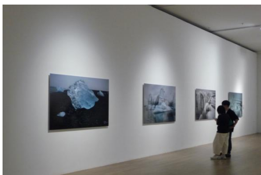
图 3-1 成都 2021 年双年展线下展览

笔者认为元宇宙是未来的一种趋势,与绘画相结合也有利于在虚拟世界的发展,因为绘画不仅仅是绘制作品,我们创作出作品的同时也需要除了自己以外的观众来进行欣赏,所以我们也不可避免地会有展览的需求(图 3-1);那么元宇宙就可以成为这个有利的帮手,通过这种虚拟化的手段,我们可以不被局限于线下的展览,现在我们很多学习以及工作都需要通过网络线上进行,同样画展也可能逐渐转移到线上,但是目前线上展览还不是那么地完善存在一定的局限性,例如(图 3-2)中,我们只能看到作品的图片不能直接地感受到作品的细节与质感,但是元宇宙可以作为一个媒介,我们通过虚拟空间或者AR技术让我可以让观者有更多的体验,仿佛置身其中,有更多的参与感的同时也能够更加清晰地感受作品的细节与质感,以及作品想要传达的理念;并通过某些社交软件、公众号将自己的作品虚拟化进行出售,这样还可以丰富人们的生活,让人们联系更加的密切,虚拟世界可以随时随地面对面的交流,可有结识更多的朋友,让生活更加愉快。