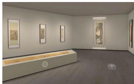
图 3-2 《古意的生成—明清书画研究展》线上展览截图