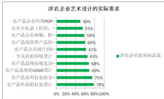
图 3 涉农企业艺术设计的实际需求

面主要有农产品单品的包装设计、农产品品牌的LOGO设计、农产品品牌的视觉识别设计、农产品专卖店的环境设计、农产品企业展厅/展会/办公室设计、农产品海报和产品目录插页设计、农产品企业画册、折页设计、农产品企业终端POP设计等方面。