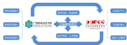
图2 校外基地与学院专业建设联动模式示意图

在线上平台的构建中,由于学院茶专业群主要为涉农企业提供艺术设计、品牌包装等方面服务,因此茶专业群在平台网站设计中以猪八戒、站酷等设计服务类网站作为模板构建线上社会化服务平台。同时,配合网站的构建,还利用移动互联网配套建设了相应的微信公众号“天地汇”品牌设计。在线下领域,广西职业技术学院茶专业群与南宁市江南万达商业区的“天地汇品牌设计机构”开展合作建立学院的校外实践基地和线下社会服务平台。线下平台专业提供农产品品牌形象策划、农产品包装艺术设计,服务省内外百余家农产品企业。这一机构不仅是广西职业技术学院社会化服务对外窗口及线下服务平台,又是广西职业技术学院艺术设计专业校外实践的基地,还可以为艺术设计专业教师提供挂职锻炼的机会,基地与学院专业建设的联动模式如图2所示。