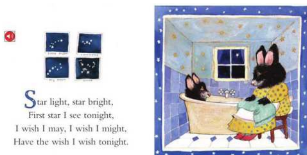
图一 My Very First Mother Goose