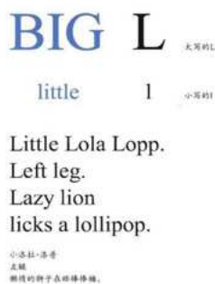
图四 Dr. Seuss's ABC