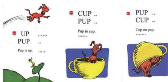
图三 Hop on Pop

在廖彩杏书单中,苏斯博士的作品是应用自然拼读法的典范。儿童可从他的儿童读物中学习押韵和词族。他的图画书,语言简单,情节亲切而诙谐。例如,Hop on Pop是一本儿童读物,其里面有着24个丰富的押韵示范,比如up, -ouse, -all, -ay, -ight等其他字母组合,孩子们可从中学会解码单词和正确地发音。与鹅妈妈童谣的温情相比,苏斯博士的作品是一部具有鲜明卡通风格的滑稽短剧。如句子“UP/ PUP/ PUP is UP./CUP/ PUP/ PUP in CUP./PUP/ CUP/ on PUP./”(Dr. Seuss, 1991: 3-5)生动地展示了PUP和cup之间的有趣故事。此书情节并不连贯,但每一页都有着属于自己的单元。上下文押韵和连续的主题为孩子们的阅读提供了乐趣和兴趣,因此它非常适合英语初学者。