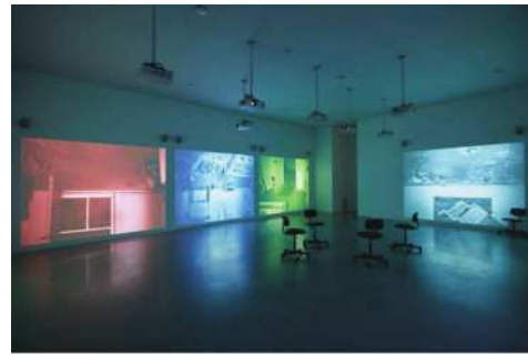
图三 空间层次感的设计

艺术作品的展示与环境的设计密不可分，作品需要在特定的地点发挥自身的优势，需要参观者在观看中能够看到其中的艺术气息，环境的设计非常重要，只有吸引人的设计才能把参观者吸引到其中 [8] 。一个好的设计把人的审美、听觉都融入到其中，每一个环节都能够与作品呼应，环境又与参观者紧密相连。在设计作品的地点时要采取动态化的展示方式，不能使一个不动的作品，参观者会随着变动而改变，要考虑到心里的变化，参观者可以从不同的角度观看到不同的画面，满足心理上的需求，在参观者脑中展现一个丰富的形象 [9] ，体会到作品的美感，作品附近环境的变动要遵循层次感，与作品产生一个完美的呼应，参观者在观看过程中被吸引到其中，营造一种赏心悦目的气氛。如图三所示空间层次感设计。