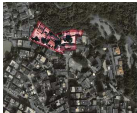
图1 鳌湖村地理位置

鳌湖村（图1）位于深圳西北部的龙华区内，属于东莞接壤地带。该村东临牛湖水，北靠求雨岭山（海拔最高100米），西依观澜湖，南接观澜湖大地生态艺术园。总体地势为山区丘陵谷地，中有田段可耕土地。