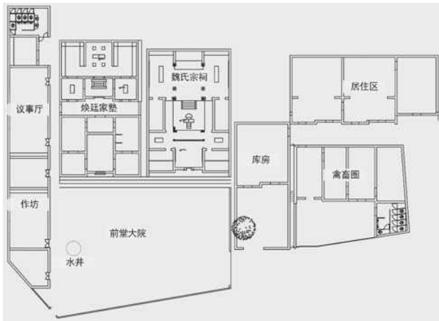
图5 魏氏家族建筑群空间形态与格局

目前魏氏家族所拥有的客家排屋共有6栋35间，空间布局“非”字形排列，其空间功能丰富，集生产、生活、文化、教育和防御于一体。主要以住宅区、煥廷家塾、祠堂、院落、公共水井、库房、禽畜圈、议事厅等空间区域组成。(图5)