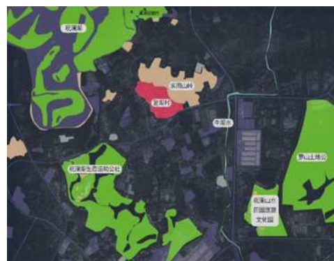
图3 鳌湖村山水格局

鳌湖村地处山水之间，村口处设置了风水塘，地势具有“负阴包阳”的特点，且具绵长历史文化。这正符合“城市山水人文空间格局”的概念。古人云“郡邑城市时有变更，山川形势终古不易”，因此，老村的规划需要与山水环境作为整体考虑，使其在作为生活之地的同时展现文化精神内涵。