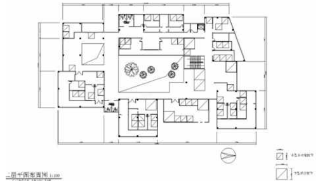
图6 一层平面布置图图片 源于:自绘

路线规划:以赶集者对各类商品的需求量、购买频率、步行可达性,以及方便商贩运送货物为依据进行功能分区设计,并将集市摊位与步行系统、货运通道及停车场便捷连通,提高道路通行能力、保证交通秩序。