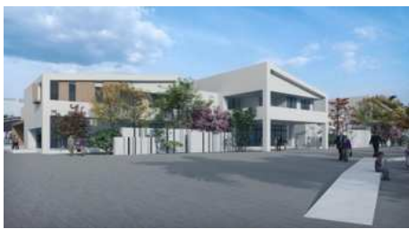
图5 休闲广场效果图