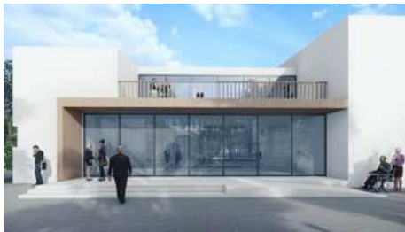
图4 休闲广场效果图

建筑设计表现手法:手法主要运用了立意性手法、布局性手法、单体处理手法以及细部处理手法。建筑采用了简单的方块切割成体块,建筑外观设计来源于“回”字型,在此基础上变形,体块切割来。其次将建筑语言化、符号化,产生众所知的共识性符号,然后纳入整体设计中,如门窗、栏杆、踏步、檐部等。由于服务人群不同,所以在设计门窗、栏杆、踏步的时候,还加入了无障碍通道,方便老人的同时还方便摊贩货车的使用,如图4、图5建筑效果图所示。