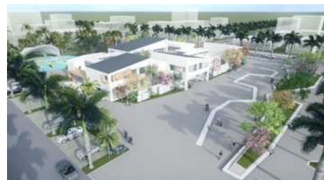
图 1 整体效果图

总体规划设计:全方位的立体层次分布,运用平坦式休闲广场、铺地落差、植物配置等等手段进行高差的创造和空间转换,满足居民对新型集市的追求。该方案选址为黄坡镇中心区域,地形平坦,交通便利,集市也是坐落各村中间,为了方便村民使用,在设计上以现代风为主。集市景观设计的成果是供附近村内所有居民共同休闲、欣赏、使用的,我们在设计中全方位着眼考虑设计空间与自然空间的融合,不仅仅关注于平面的构图及功能分区,由于地理位置原因终年受海洋气候调节,冬无严寒,夏无酷暑的气候特点。所以在植物配置中,选用热带特有植物为主。因黄坡圩离出海口仅有六七公里远,受台风影响多,所以在阔叶植物选用时,用了大王椰子树、糖胶树等抗风性强的植物作为绿化带主要树木,其他植物为辅去设计。如图 1 整体效果图效果图所示。