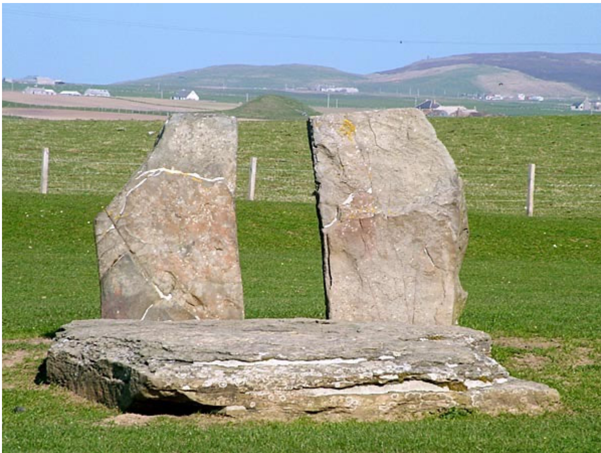
图2 迈绍威的室穴与两块多曼石之间的缝隙对齐

建造追溯到公元前4000年后期，入口被认为是明确的朝向仲冬光线出现的方向 15 。入口（图1），似乎有一个巨大的石门挡住了主通道的外端，而带有装饰性门楣的长方形通道：“信箱”被精心建造在最外层。