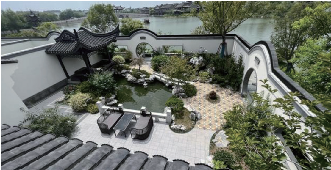
图1-2 传统文化景观设计