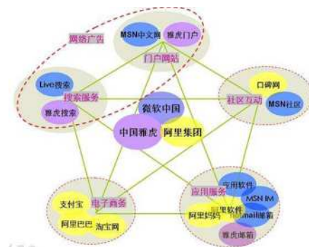
图1 网络经济对现代企业的影响

互联网+技术代表了一种在线开发的新型业务,旨在推动创新时代2.0,一种新型的知识社区形式。这也是在知识共同体发明的2.0时代以互联网形式蓬勃发展和发展的新经济。互联网+技术很容易被描绘成互联网+文化产业。随着中国科技的迅速发展,互联网技术越来越多地投入到传统产业的发展中。我们利用互联网的优势来开发、转型和完善传统产业。我们开创了信息经济发展的新时代。互联网+技术的实用原则是创造和过渡产业,加速经济增长,并利用它通过互联网的便利和效益,将互联网与传统工业生产和绩效充分融合,从而引领整个社会和经济组织的升级。互联网+技术的广泛使用体现在企业产品管理、经营方法、发展方向等部门的创新和转型上。