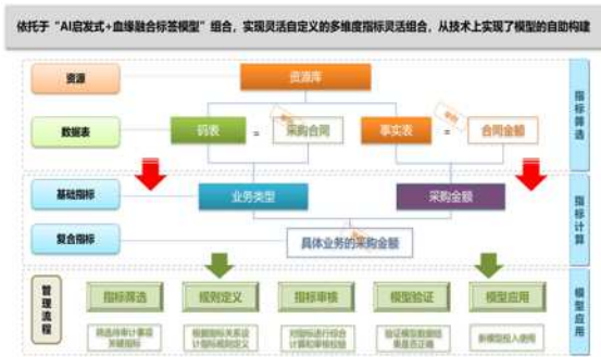
图5 AI启发式+血缘融合标签模型组合