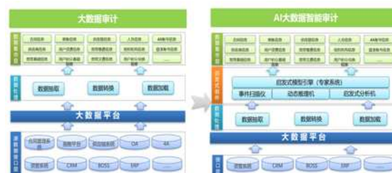
通过应用启发式组件，构建“活字印刷式”模型应用，提升模型应用能力

2. 基于 AI 的大数据智慧审计平台： 在大数据审计平台嵌入 AI 启发式原子模型引擎，从传统的大数据智慧审计平台升级为“基于 AI 的大数据智慧审计平台”，从而提升了大数据智慧审计系统的智能度。