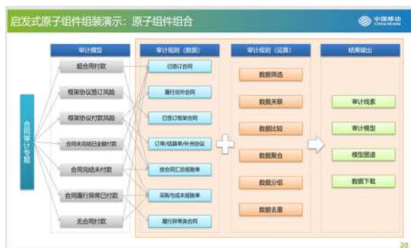
图 2 AI 大数据审计平台原子组合示例

展现层： 展现层为通过模型运算，大数据审计平台展现的审计结果。“启发式审计平台”在原有的大数据审计平台的功能基础上，增加了大量的可视化组件。如用户可直观的对整个模型的运行过程进行预览，原有大数据平台处理过程中的部分“黑盒”处理过程也变得显而易见。此外，展现层增加了多种展现方式，使得展现过程更智慧，更直观。AI 智慧审计模型原子组件组合实例如图 2。