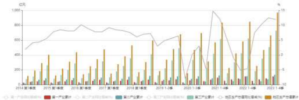
图 1 三亚 2014–2023 年 GDP 统计表

显然，居民收入与经济发展关系紧密，农民收入的同比波动与 GDP 在时间上吻合，说明三亚农民的收入主要由旅游业主导，参与程度较深。