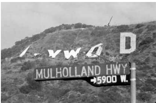
图3 工人们准备取下标志上的字母“D”

“HOLLYWOODLAND”最初建设时只用作临时标志，所用的木材和钢铁并未作长久打算。因此，到了20世纪40年代“HOLLYWOODLAND”标志已经“过度老化”。与此同时，美国经济正处于大萧条时期，好莱坞及其房地产开发项目的失败，导致该标识的定期维护停止。总的来说，“HOLLYWOODLAND”标志仅完好存在了一年半的时间。直到一个名为霍华德·休斯的商业巨头在1940年买下了“HOLLYWOODLAND”标志以西的138英亩土地，并计划建造一座大厦，标志才迎来了第一次修复希望，然而由于其他原因干扰，最终计划被取消，导致“HOLLYWOODLAND”标志继续衰落。当1947年有人准备再次修复这个标志时，才发现标志中的字母“H”已经消失6年了，当1949年洛杉矶市打算移除这个标志时，好莱坞商会与洛杉矶市公园部门签订了修复和重建标志的合同，合同内容包括去掉标志上所有的灯泡和“HOLLYWOODLAND”的“LAND”部分，拼为“HOLLYWOOD”。自此，标志获得了一个新的身份，作为城市和术语的象征“HOLLYWOOD”——娱乐产业。