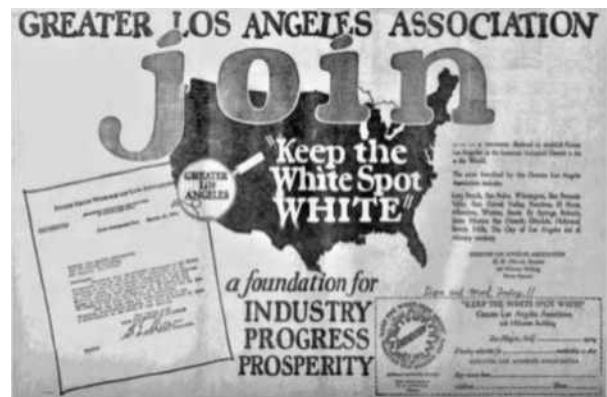
图2 洛杉矶快报“keep the white point white”

“keep the white point white”是1924年美国的一项大胆的政治声明。美国商会1920年至1921年出版的商业地图描绘了全国的商业状况，其中黑色阴影区域表示“贫穷”，灰色区域表示“公平”，白色区域表示“优秀”。洛杉矶在灰色和黑暗的海洋中脱颖而出，就像地图上的一个巨大的白点。基于此，1924年“HOLLYWOODLAND”的标志上增加了一个直径为35英尺的白点。这不仅是一个漂亮的装饰品，更是一个政治信息，也是“HOLLYWOODLAND”标志根据时代背景而发展的象征。