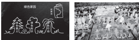
(四) 借任务驱动落实学科融合

自己的大树后，又组织学生将大树放在一起，组成一篇森林，向学生讲述森林内的小动物故事，为学生播放《熊出没》动画片中因过度砍伐树木导致森林消失的惨状，让学生体会爱护树木的重要性，引导学生形成爱护树木、节约纸张、少用一次性筷子的良好道德观念。通过在教学中创设森林的情境，以任务为导向，推动学生不断展开探究，从而渗透道德教育，让学生的人格得到健全的发展。