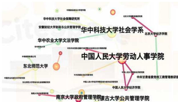
图 3 我国机构合作网络图

综上所述，国内发文量较多，但机构之间未形成紧密的合作群体。从研究机构发文量分析，中国人民大学劳动人事学院发文量最高，发文数量为 16 篇；其次是华中科技大学社会学系，其发文量是 11 篇；第三是武汉大学社会保障研究中心，发文量 8 篇。由研究机构的性质来看，发文量前三均是我国高等院校。