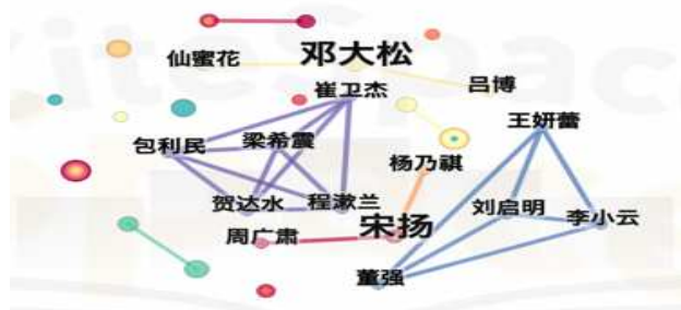
图 2 关于中国低保制度研究的国内作者合作网络图

刘启明为中心形成的小范围研究群体。总体来说，我国关注低保制度相关研究的研究者分散，整体上未形成核心的研究群体。