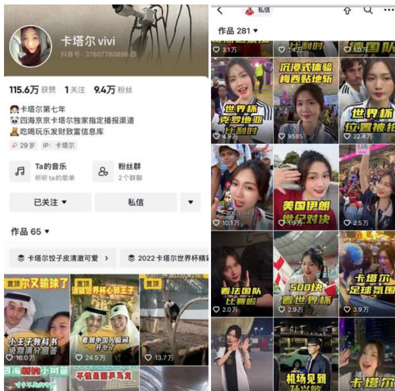
图 1-1 卡塔尔 vivi