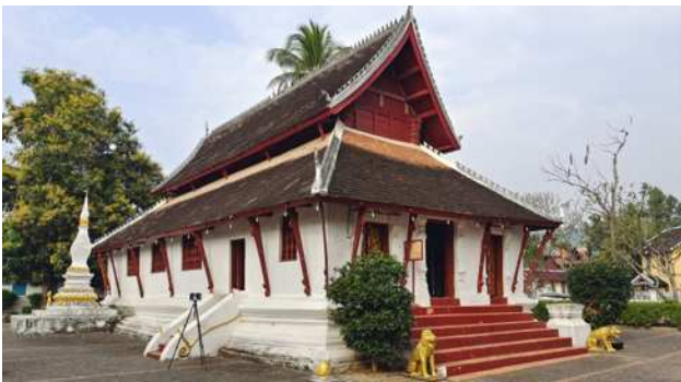
图 1. 帕坎寺建筑外观

使宗教叙事充满现实生活情趣。这些木雕作品在斜阳照射下呈现出丰富的光影层次,人物形象丰腴典雅,既彰显了宗教的尊贵感,又传递出世俗生活的活力。内部装饰以红色漆木与金色模板为主要材质,主祭坛供奉的释迦牟尼佛像采用“召唤大地见证”的经典姿势,周围环绕的小型佛像均以金箔包裹,与红色立柱形成强烈视觉对比。这种“红金配色”是琅勃拉邦寺庙的典型特征,红色象征生命力与守护,金色代表佛法的光辉,二者的结合构建了神圣的宗教氛围。2011 年修复时发现的 18 世纪原始金箔模板残片表明,这种装饰工艺在帕坎寺建成之初便已存在,且工艺水准与同时期的香通寺一脉相承 [5] 。