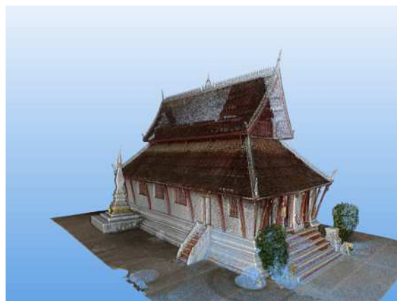
图 2 帕坎寺三维旋转扫描结果

数据采集的方法采用三维精细化数据扫描技术，基于三角测量、飞行时间法、相位测量法等方法，融合光、机、电与计算机等技术进行测量。针对帕坎寺这一著名建筑文化遗产，团队使用激光三维扫描仪，通过发射并接收激光，测量时间差或相位偏移计算距离，结合角度编码器记录的角度，获取物体表面三维坐标，形成点云数据；部分扫描仪集成相机，可生成带纹理的三维点云模型。该模型可 360 度精准还原帕坎寺的建筑特征，丰富原有的建筑档案，并为帕坎寺之后的维护和返修提供有力参照。