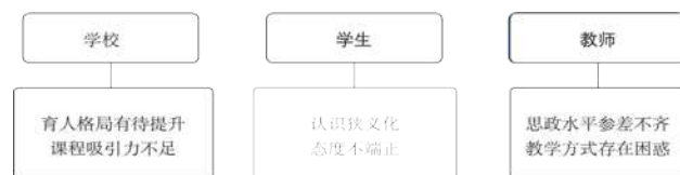
图1 “课程思政”调研存在问题

谈和集体座谈。通过对问卷及访谈的分析整理，认为云南经济管理学院之前实施的“课程思政”中在学校、教师、学生三个层面存在问题，总结如图1所示：