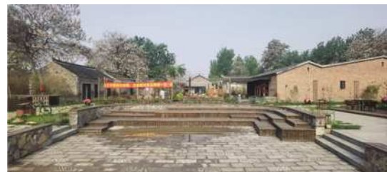
图2 中心活动区下沉式广场

药王村分为新村和老村,民俗村坐落在老村区域,这里保留着传统村落老旧房屋,带有历史感,对原本现存的建筑修旧如旧,景观规划结合建筑风貌,“建筑与景观的融合需要注重对于建筑外立面的营造,在这一过程中,相关人员需要增加不同景观要素在建筑风貌中的比例,营造空间整体的秩序感与序列感。” [5] 药王村地势平坦,没有明显起伏高低的先天条件,景观规划设计上需要注重空间的层次感,着重竖向设计,如在中心活动区设计一个下沉式广场,采用木质和青砖铺装,和建筑场景相融合(图2)。新村的规划设计也要增强同老村的联系,应该采取多元化设计,加强场地文化的融合,主要体现在文化元素的提取、空间材料的使用、细节的处理等。