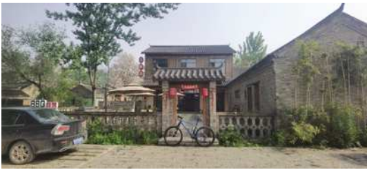
图3 华膳坊

在建筑外立面和景观空间设计中融入文化元素，运用多种手法，实现建筑景观的融合；另一方面通过民俗活动、历史文化展厅、美食体验等，让游客在活动体验中感受药王村当地特色文化。利用中药材种植和古井贡酒的产业优势，打造独特的药都酒乡的田园综合体，药王村打造一家特色餐饮美食——华膳坊（图3），主打养生药膳，结合当地中药文化和养生文化，独具当地特色的餐饮美食吸引着大量的游客来此体验。重大节日在民俗村中举办特色民俗活动，游客休闲养生放松之余，可以感受当地的民俗文化，药王村实现吃住玩购一站式体验。